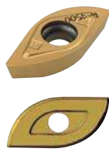
Паз на установочной плоскости