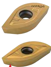
Опорная боковая поверхность